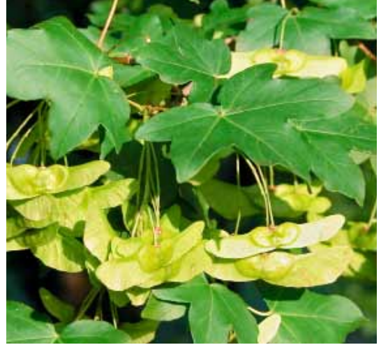
Feldahorn mit Früchten, die waagerechte Flügel haben.

Eigenschaften und lindern so Insektenstiche, aufgedunsene Augen, geschwollene Füsse und Gelenke sowie dicke Furunkel. Bei Quetschungen oder Prellungen pflückt man einige frische Ahornblätter,