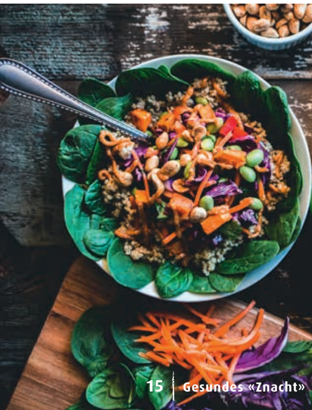
15 | Gesundes «Znacht»