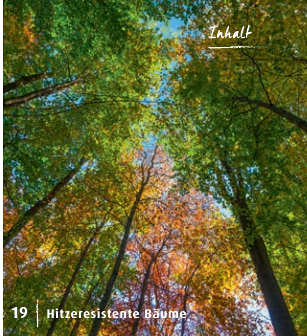
19 | Hitzeresistente Bäume