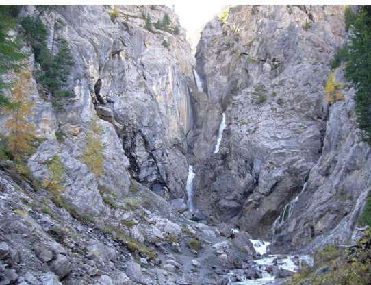
In drei Stufen stürzt der Ducanbach über den Wasserfall im Sertigtal.

BierVision Monstein AG, Brauerei, 081 420 30 60, www.biervision-monstein.ch