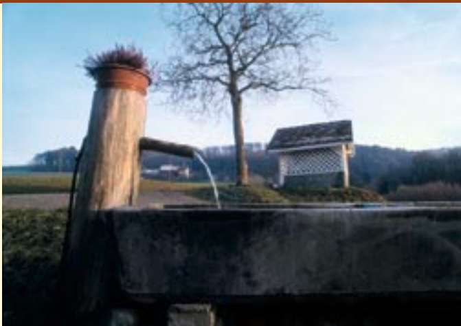
Henniez für einmal aus der Brunnenröhre.