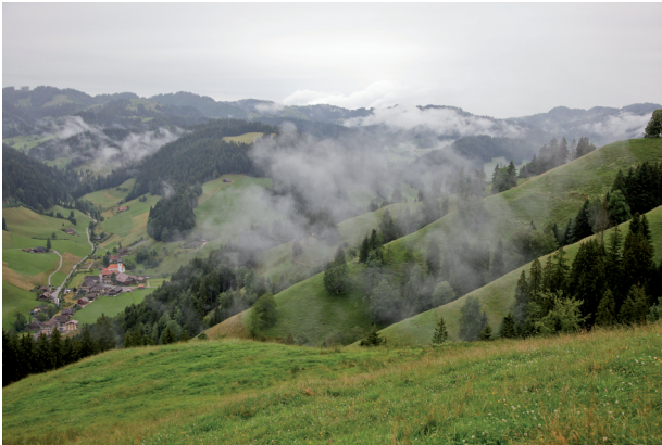
Nebelverhangene Hügel. Unten im Tal das Dörfchen Trub.

Ober-Altgfääl: Besenbeiz mit Feuerstelle (Selbstbedienung Getränke und Snacks).