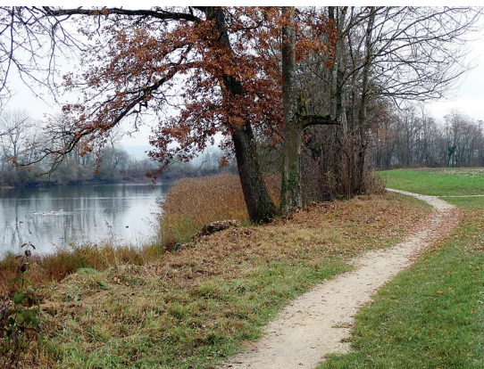
Idyllische Flusslandschaft im Naturschutzgebiet.

1 Objekt von nationaler Bedeutung (A-Objekt) im Schweizerischen Kulturgüterschutz-Inventar 2009.