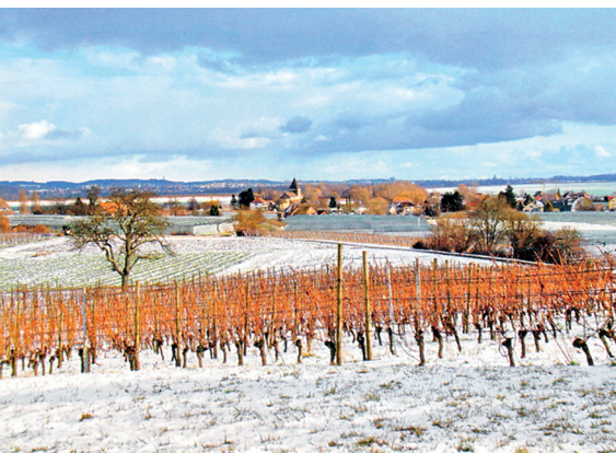
Blick auf das winterliche Oberzell mit der Kirche St. Georg.

Hotel Restaurant Mohren Ganter Pirminstrasse 141, Mittelzell, D-78479 Insel Reichenau, Tel. 0049 753 499 440.