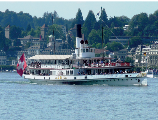
Das Dampfschiff Uri ist das älteste Dampfschiffe der Vierwaldstättersee-Flotte.

Informationen zur Schifffahrt auf dem Vierwaldstättersee, www.lakelucerne.ch